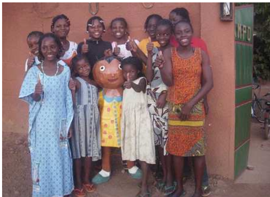
Photo des nouvelles filles admises dans le centre

L'hébergement : Comme toute structure fermée, les pensionnaires sont internées dans le centre. Au cours de cette année 2008-2009 AMPO Annexe a hébergée 54 filles vulnérables sans distinction d'ethnie ni de religion.